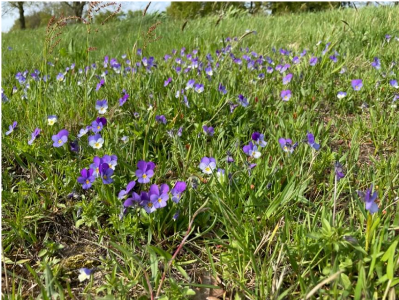
Driekleurige viooltjes in de berm bij de Ommermars.

Waardplant (= voedselplant van rups) voor parelmoervlinder.