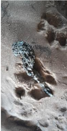
Otterspriet (met veel visgraten) onder de Hessel Mulertbrug

Door watervervuiling, aantasting van zijn leefgebied en verkeersongelukken ging het tot in de jaren '80 heel erg slecht met de otters in Nederland. Zo werd in 1988 de laatste (Nederlandse) otter in ons land doodgereden op de A7 bij Langweer (Friesland). Gelukkig is door o.a. waterzuiveringen, de vervuilingen in het oppervlaktewater nu een stuk beter geworden. Vandaar dat er in 2002 weer Otters in Nederland uitgezet konden worden. De eersten in de Weerribben, maar later ook in andere delen van Nederland. En met succes, de schatting is dat er nu zo'n 500 otters in en langs de Nederlandse wateren leven. Ook in de Overijsselse Vecht en in de Regge komen we weer regelmatig Ottersporen tegen. En af en toe worden ze daar zelfs overdag waargenomen. Toch blijven otters erg kwetsbaar en worden er, ondanks aangelegde faunapassages etc, nog steeds veel doodgereden op onze gevaarlijke verkeerswegen. Geschat wordt dat jaarlijks ca 25% van de otterpopulatie om het leven komt door aanrijdingen!