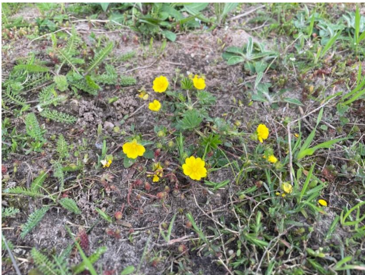
Voorjaarsganzerik. Een van de eerste bloeiers. Familie van de aardbei.

Engels gras is een zoutminnende plant die vooral langs de zee kust groeit. Door het strooien van zout langs wegen groeit hij tegenwoordig ook langs snelwegen. Het is langs de Vechtkade een bloeiende getuige van een verleden als wegberm van de doorgaande weg van Zwolle naar Hardenberg die 10-tallen jaren dwars door Ommen liep. Ik ben heel benieuwd hoe lang dit plantje het hier nog volhoudt nu het "zoutloze tijdperk" is aangebroken.