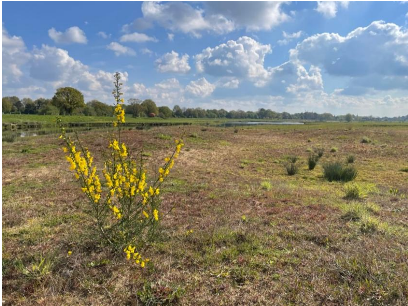
Deze nu nog eenzame brem kleurt het rivierduin in de Ommermars prachtig geel.