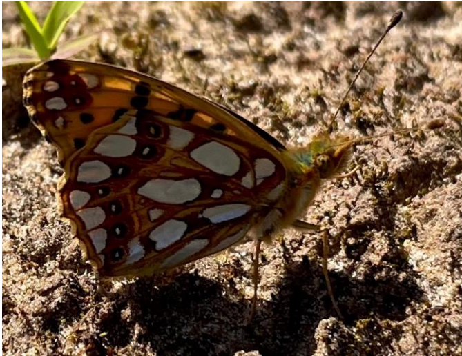
Kleine parelmoervlinder. Legt eitjes op viooltjes.