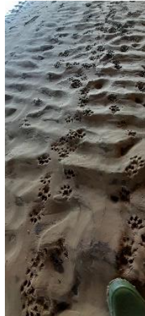
Duidelijke (verse) otterprenten onder de Hessel Mulertbrug